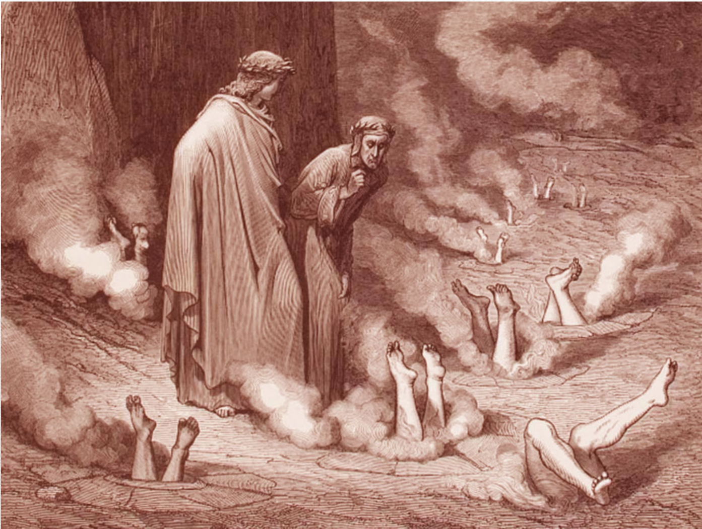
Canto XIX: VIII cerchio, III bolgia (i simoniaci, papa Nicolò III)