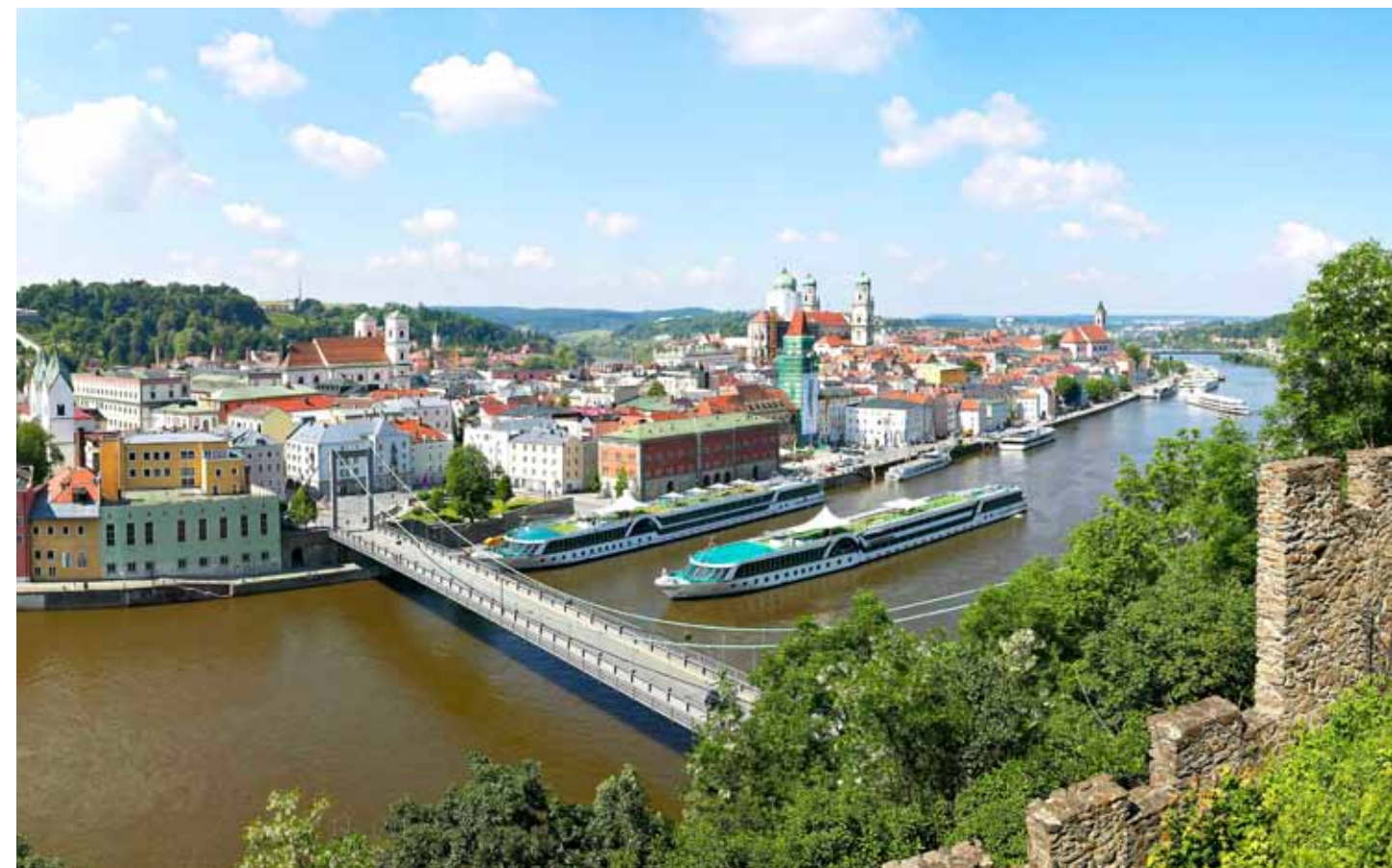
A sinistra, un passaggio sotto ai ponti sul Danubio della cittadina tedesca di Passau. Sotto, da sinistra, la nave Amadeus Diamond davanti al palazzo del parlamento di Budapest e la Amadeus Princess all'attracco a Coblenza, sul Reno. Itinerari di Lüftner Cruises proposti in Italia da Gioco Viaggi.