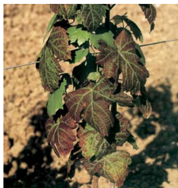
Sintomi su vitigno a bacca nera.