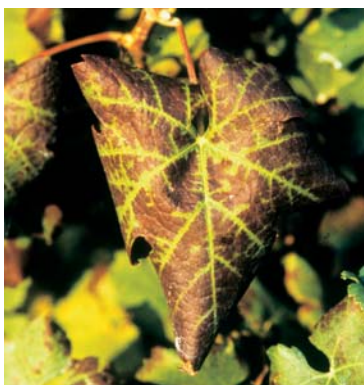
Tipico accartocciamento del lembo fogliare con nervature che rimangono verdi.

Nell'autunno, le foglie dei ceppi più colpiti diventano bronzate, necrotizzano e cadono precocemente.