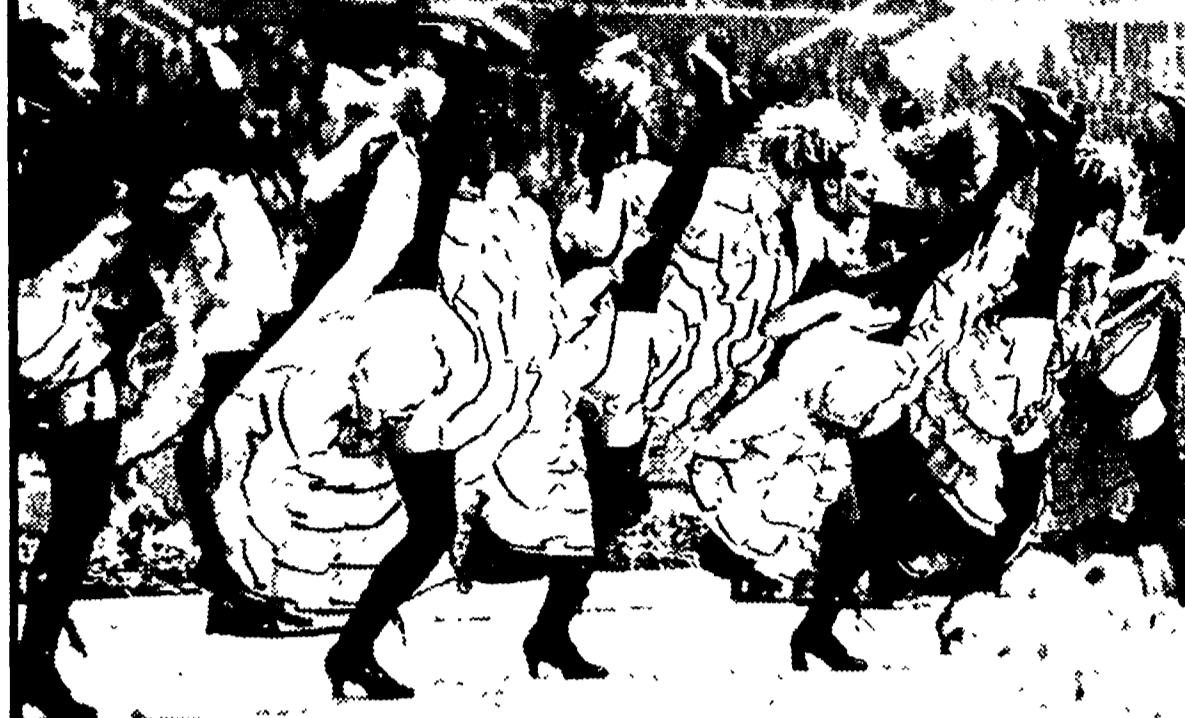
Un po' di can can dà tono e spettacolo alla «Sei giorni»