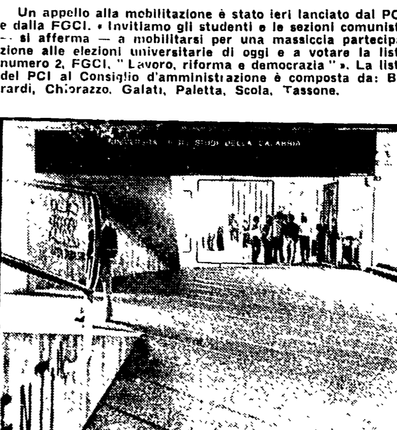
Un appello alla mobilitazione è stato ieri lanciato dal PCI e dalla FGCI...

Dalla nostra redazione CATANZARO — Sono quasi quattromila gli studenti che oggi si recheranno alle urne per rinnovare gli organismi di gestione dell'Università della Calabria.