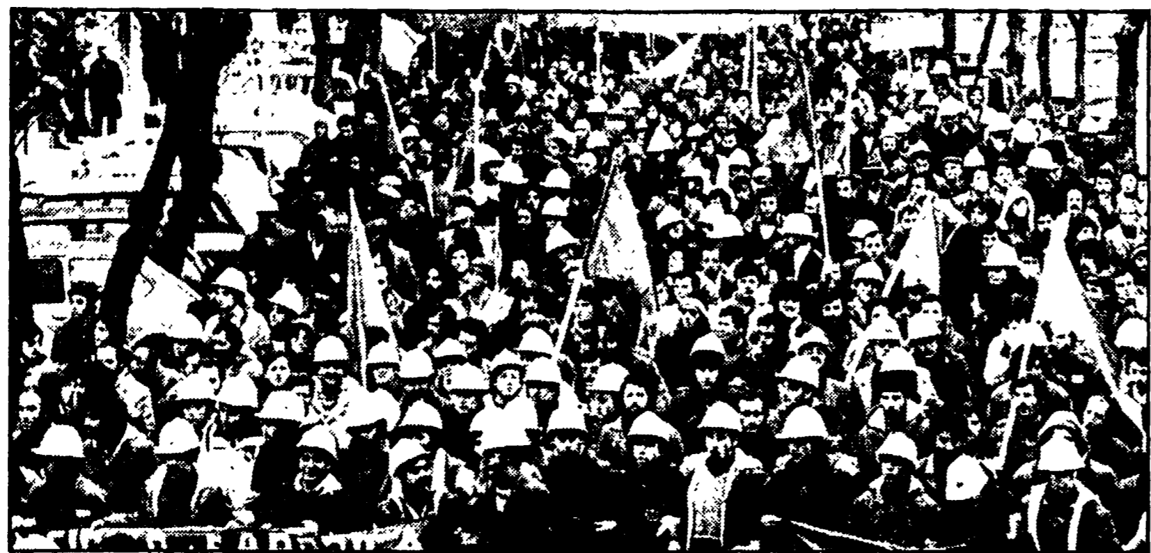
Una manifestazione a Cagliari per la difesa dei posti di lavoro e lo sviluppo della Sardegna

Le elusive risposte del portavoce di Prodi ai lavoratori di Cagliari e Porto Torres - La ripresa della lotta - Chiesta una proroga della cassa integrazione