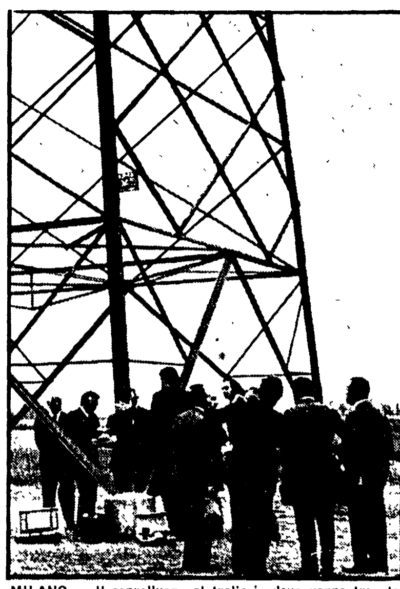
MILANO - Il sopralluogo al traliccio dove venne trovato il cadavere di Feltrinelli

L'assassino calabrese Una trentina di imputati E' l'attacco aperto al lavoro di massa e unitario delle organizzazioni storiche del movimento operaio.