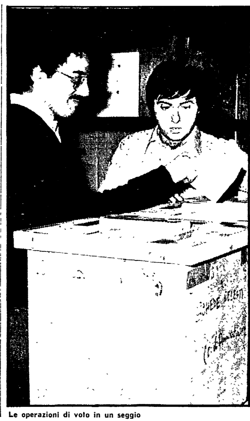
Le operazioni di voto in un seggio