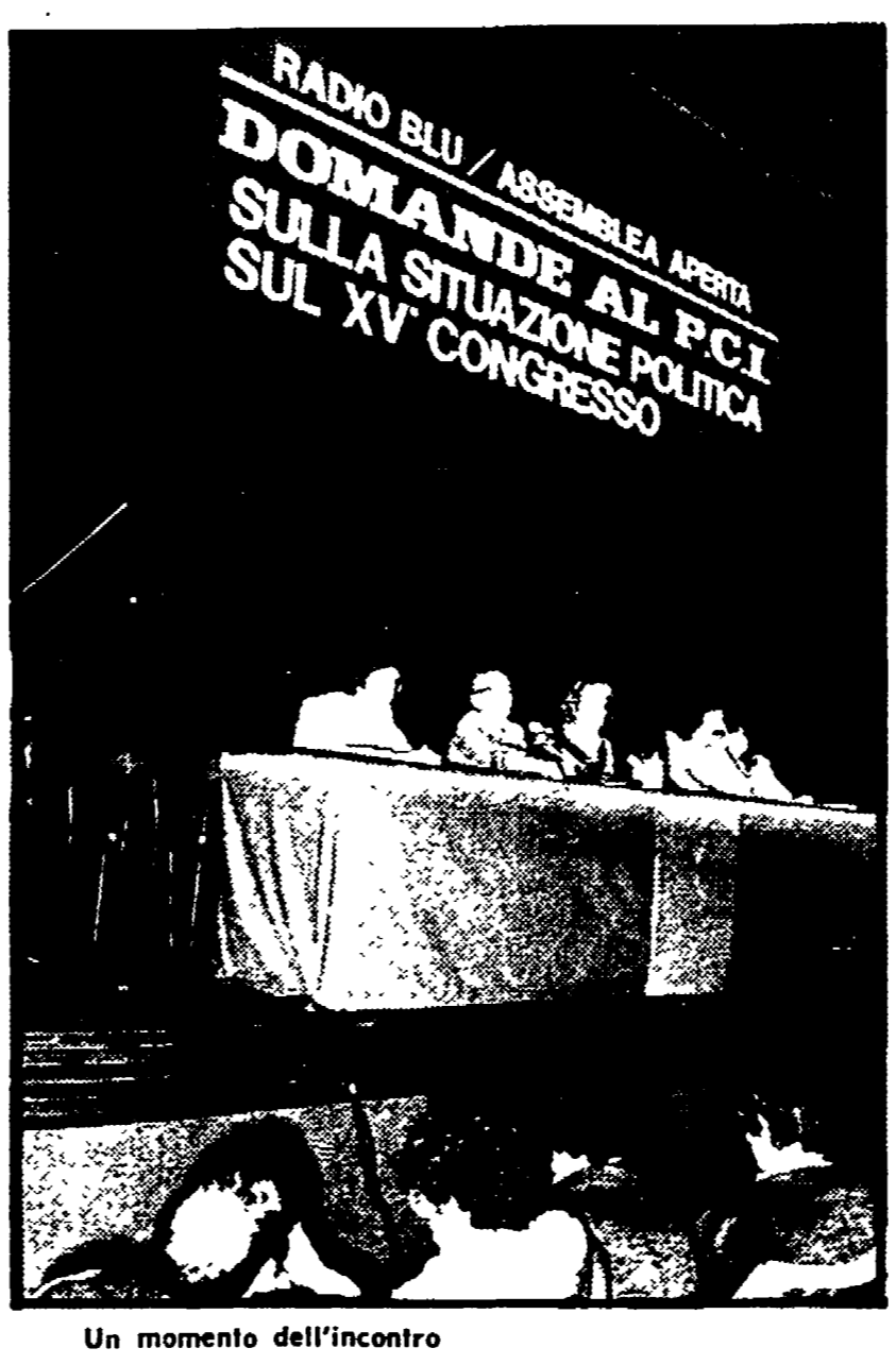
Un momento dell'incontro