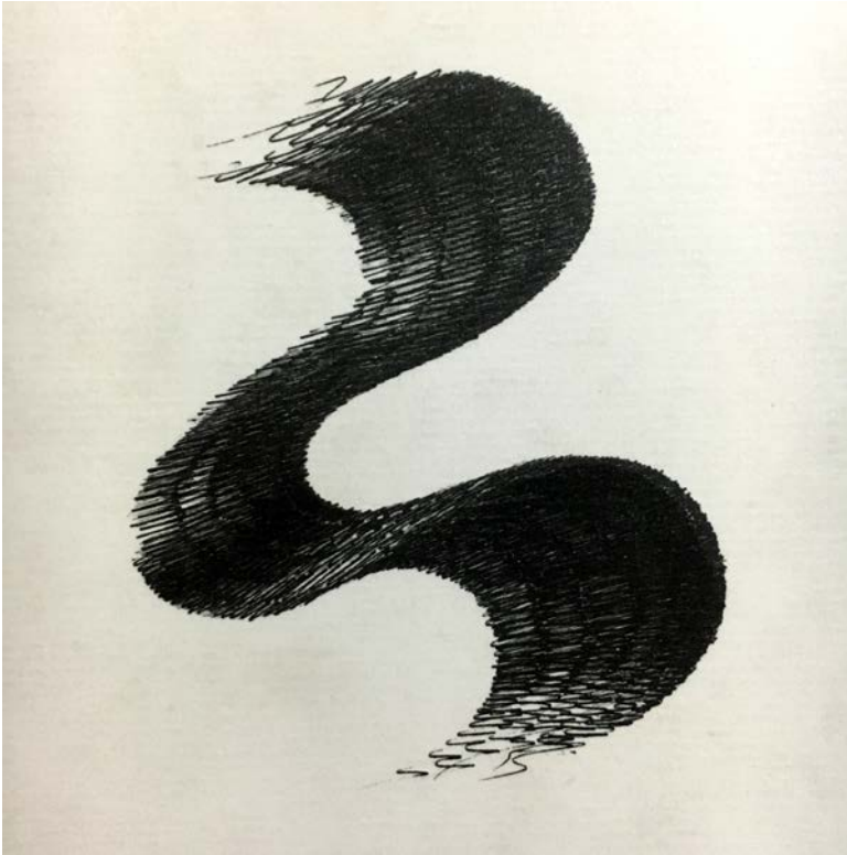
Fig. 1.1 - Il disegno di Fabio Meneguzzo posto in copertina e fra le sezioni di Trapianti (2002), su gentile concessione di RCS libri

Quanto scritto da Joyce, allora, si pone a suggello di questa fenomenologia acquatica, dove, lo abbiamo visto, l'acqua non sigla solamente un'interconnessione di tipo biosferico tra il soggetto umano e la realtà naturale circostante 75 , ma si pone alla base stessa della scrittura, quale elemento seminale e generativo 76 , in un sistema/non-sistema di "natazioni occulte" (C60, 14), insinuatosi nelle pieghe della mente e del testo.