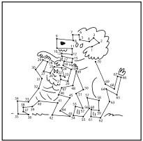
pag. 10 CRITTOCRUCIVERBA