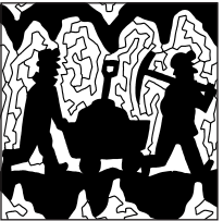
pag. 10 CRITTOCRUCIVERBA