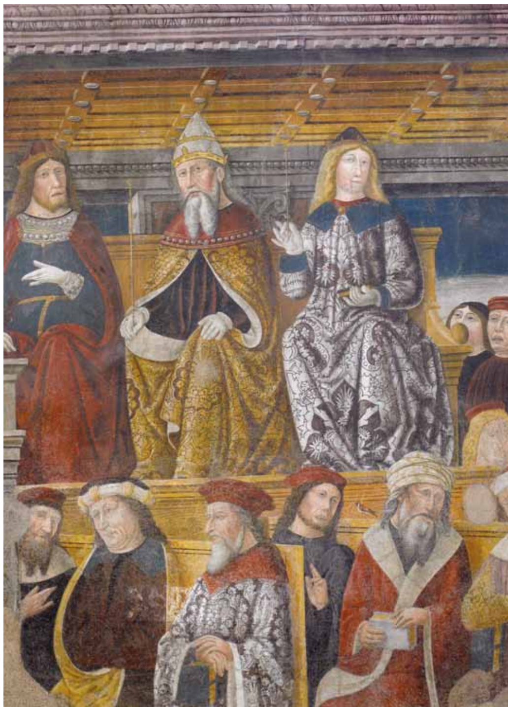
3. Giovan Pietro da Cemmo e collaboratori, Magister universale di Sant'Agostino (particolare), 1490, Brescia, Ex convento di San Barnaba