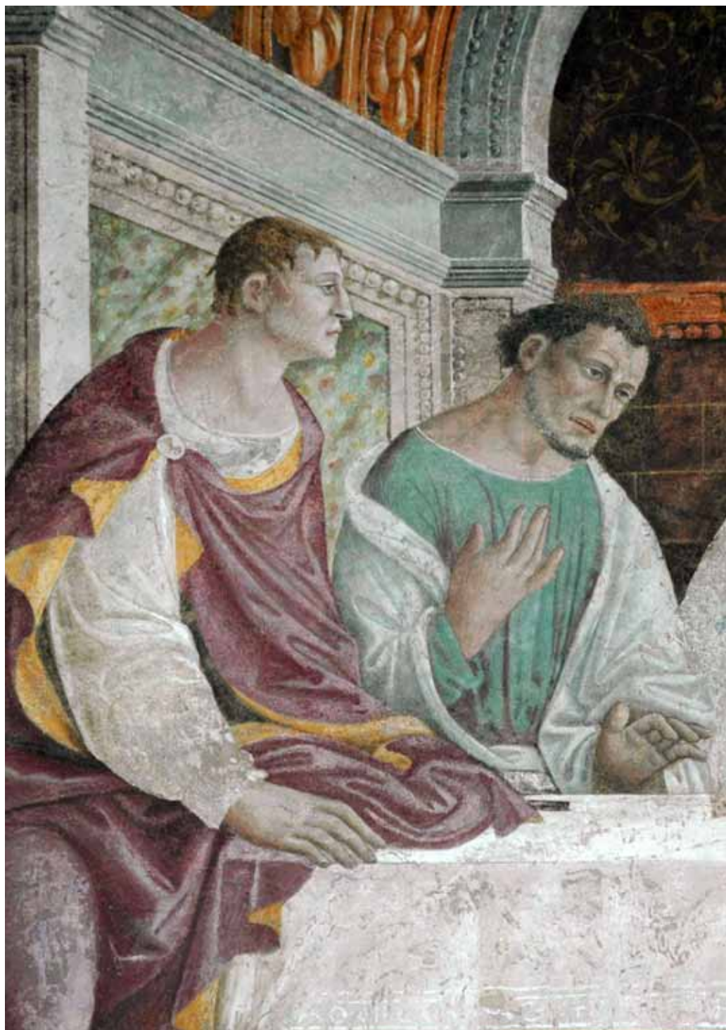
7. / 8. Giovan Pietro da Cemmo, Ultima Cena (particolare), 1507, Crema, Ex convento di Sant' Agostino