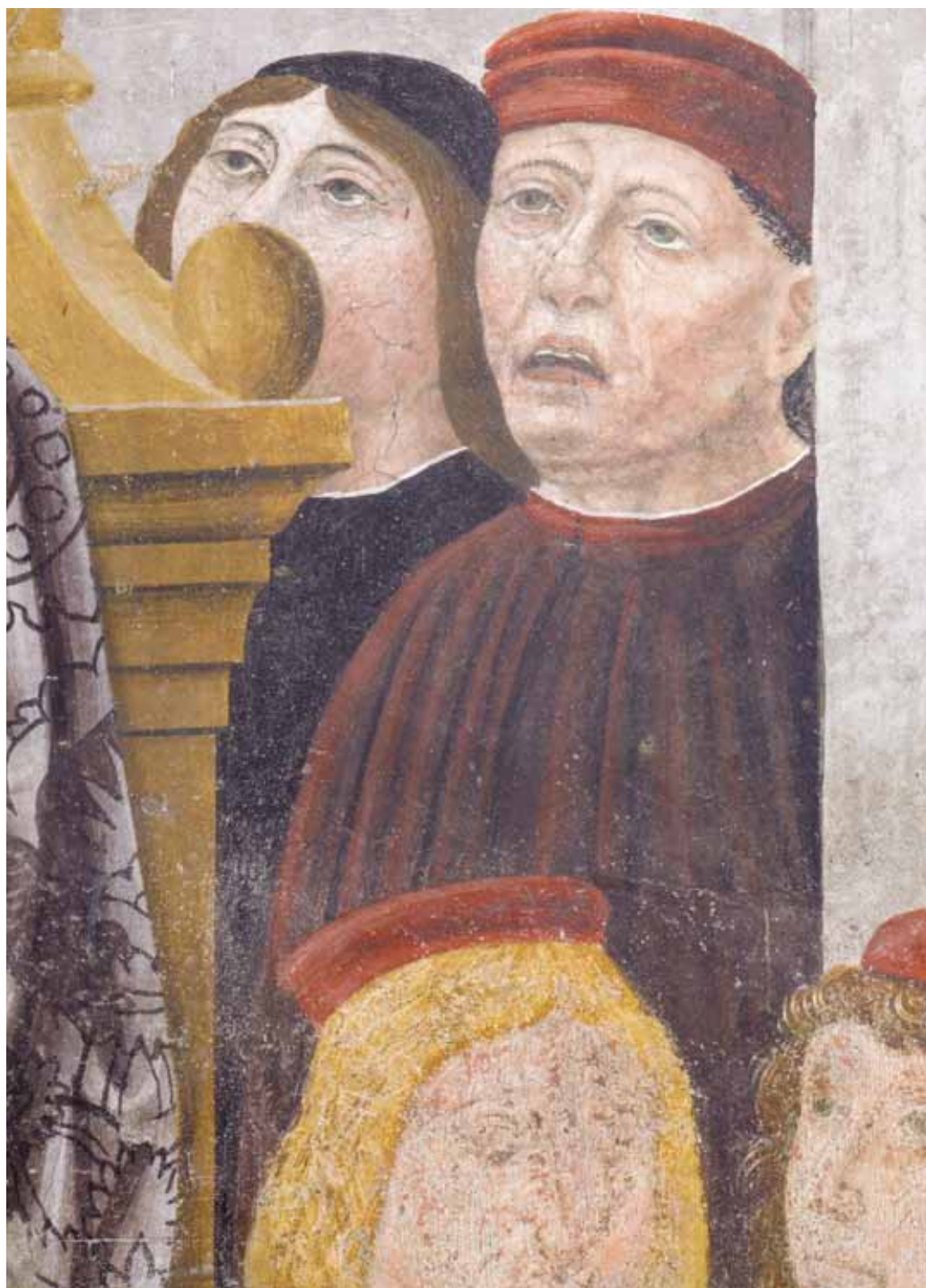
4. Giovan Pietro da Cemmo e collaboratori, Magistero universale di Sant'Agostino (particolare), 1490, Brescia, Ex convento di San Barnaba