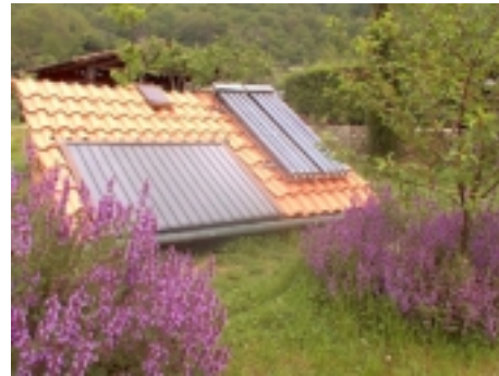
Un tetto con pannelli solari e cespugli di salvia