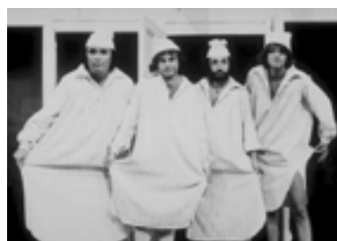
Non Stop 1978 - I Gatti di Vicolo Miracoli

di inserire il cabaret nel contesto del varietà come già aveva fatto Non Stop (vengono riproposti tra gli altri La Smorfia e i Gatti di Vicolo Miracoli ), e vengono inoltre proposti diversi sketch filmati, e anche questa è una novità. Nella seconda edizione fa la sua comparsa Daniela Poggi. Già: la signora ancora ben conservata che oggi presenta Chi l'ha visto? era una bionda fascinosa, che forse neppure lei avrebbe immaginato, all'epoca, che un giorno avrebbe condotto quel tipo di trasmissione.