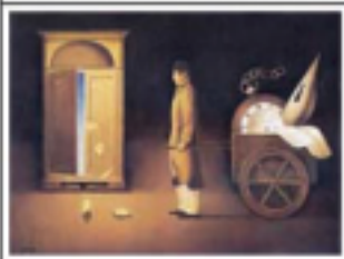
Franco Fortunato Il cacciatore del tempo olio su tela, cm 60 x 80