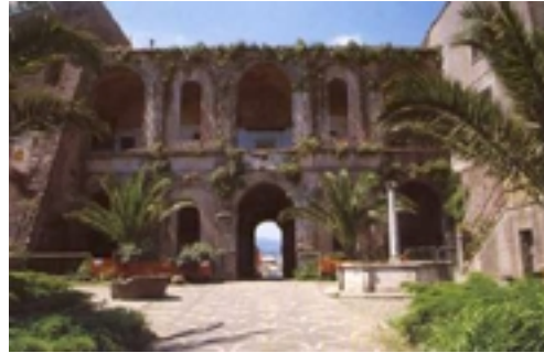
Colonna - Palazzo Colonna

La più piccola cittadina castellana ha concluso con ampio successo la prima edizione del "Settembre Colonnese", che ha visto concentrate nell'intero mese le principali manifestazioni culturali, dal "SS. Salvatore", al "Palio degli Asini", sempre spettacolare e fastoso, dalla "Sagra delle Pincinelle" alla "Sagra dell'Uva Italia, kiwi, pesche e vini pregiati". Quest'ultima, oltre ad essere l'evento conclusivo, è stato l'appun-