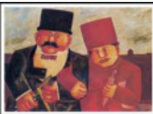
Franz Borghese Ingegnere e signora olio su tela 50 x 70 cm