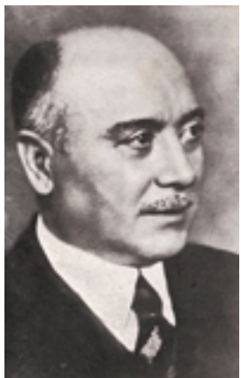
Orso Mario Corbino

Il criterio di misura sperimentale per comprendere quanto mancava alla massa critica, cioè alla massa necessaria per l'autosostentamento della reazione a catena da parte dei neutroni, era il fattore di moltiplicazione M , inteso come rapporto tra la quantità di neutroni prodotti e la quantità di neutroni assorbiti. Il fattore M aveva da tempo oltrepassato il valore 0.5: la tappa finale era quella di condurlo ad essere uguale a 1.0. La lettura dei rapporti di attività settimanali del laboratorio di Chicago riproduce con drammatica tensione la sorta di conteggio a rovescio dell'intero esperimento che si stava avvicinando.