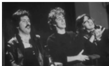
Non Stop 1978 - I Giancattivi

secondo una formula sperimentata già altre volte dal regista Enzo Trapani fin dagli anni Sessanta, non c'è un presentatore, ma si passa da un numero all'altro con ritmo sostenuto e senza sbavature. Lo spettacolo viene riproposto l'anno successivo, con un cast ampiamente rinnovato: stavolta ne fanno parte, tra gli altri, Carlo Verdone, Zuzzuro e Gaspare, Stefania Rotolo, i Giancattivi. Oltre ad aver rivoluzionato a fondo il modo di fare spettacolo in TV (ci sarebbe mai stato il tanto acclamato Drive In , senza Non Stop ?) questa trasmissione è stata il trampolino di lancio televisivo per molti personaggi. Dopo Non Stop uscirono una serie di varietà TV della RAI assai diversi da quelli paludati che dominavano incontrastati ancora negli anni settanta. Nel