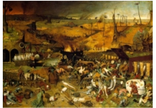
Peter Bruegel - Il Trionfo della Morte