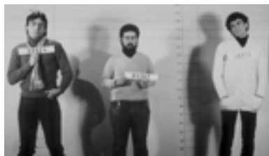
Non Stop 1978 - La Smorfia

minati vincoli. Si determina in tal modo, tra il 1977 e il 1979, una fase di transizione, in cui si sperimentano nuovi linguaggi e nuovi schemi, prima che, con l'affermazione del duopolio televisivo, e la nuova stabilizzazione all'insegna di Baudo e della Carrà, si torni ad un nuovo irrigidimento.