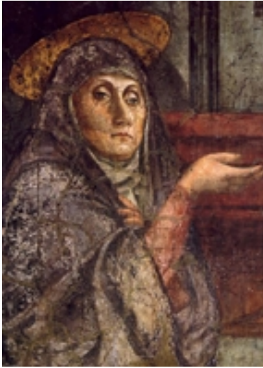
Masaccio - Particolare

Se si dovesse giudicare una mostra in base al titolo ( Rinascimento ), quella allestita alle Scuderie Papali dirimpetto al Quirinale (aperta fino al 6 gennaio prossimo) si presenterebbe certamente lacunosa. Di propriamente rinascimentale, l'esposizione offre a ben vedere pochissimo: quando si giunge nella sala dedicata a Leonardo, Raffaello e Michelangelo ci si imbatte in tre disegni soltanto del primo, in un marmo di Michelangelo ( Bruto ) e in un ritratto del cardinale Bibbiena di Raffaello. Un po' meglio le cose vanno per quanto riguarda il Rinascimento veneto: tre di Tiziano, tra cui il ritratto di Pietro Aretino, Flora , prototipo di bellezza "tizianesca" e la Maddalena penitente , e due tele di Giorgione, il suo maestro. Per il resto, al piano superiore la prevalenza è di tele d'impronta manierista, di scuola sia toscana sia settentrionale: Beccafumi, An-