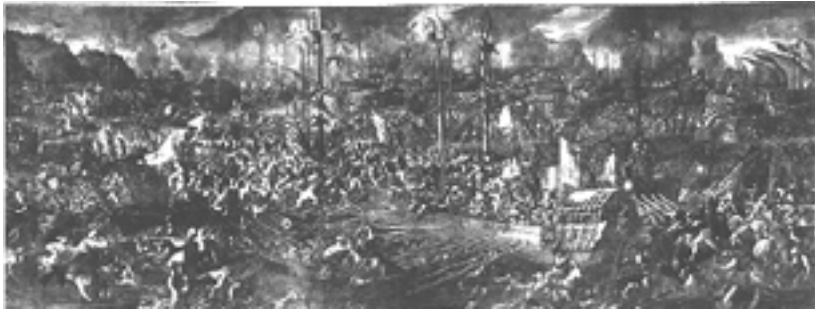
Andrea Vicentino - La Battaglia di Lepanto (XVI secolo)

Presso il Museo Civico "U. Mastroianni" è stato presentato il volume realizzato dagli allievi dell'Istituto Comprensivo "Via Marcantonio Colonna" dal titolo: "L'ebbrezza di una vittoria - da uno storico evento a una tradizione popolare". L'iniziativa è stata inserita nel programma dei festeggiamenti per la 77ma Sagra dell'Uva ed ha visto protagonisti i bambini della scuola dell'Infanzia ed Elementare S. Pertini ed i ragazzi della scuola media Ungaretti attraverso la realizzazione di disegni, pensierini, stornelli e poesie.