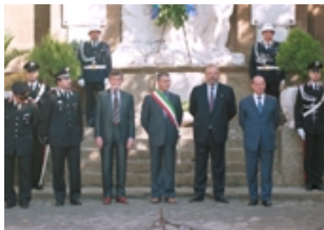
La deposizione di una corona d'alloro al monumento ai caduti di tutte le guerre

Domenica 28 ottobre 2001, giornata clou della tre giorni organizzata a Monte Compatri per accogliere i fratelli calagorritani e gli ospiti di Caussad. Giornata densa di cerimonie ufficiali e commovente per l'intensità della partecipazione di tutti i presenti.