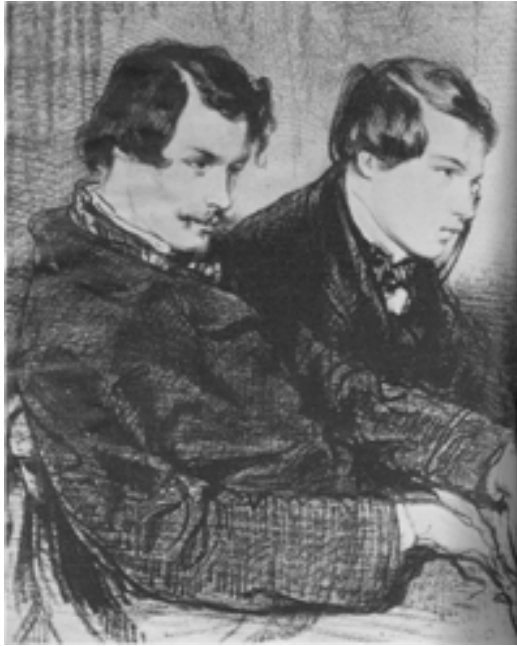
I Goncourt in un disegno di Gavarni