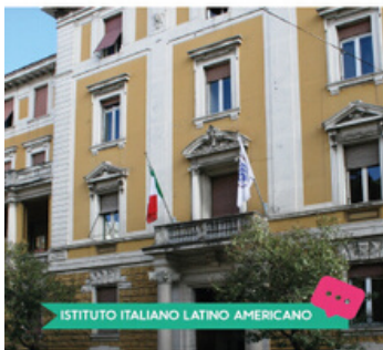
ISTITUTO ITALIANO LATINO AMERICANO

Dal 27 Aprile hanno aderito al programma #laculturaincasa alcune Accademie e Istituti di Cultura Internazionali presenti in città: