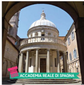
ACCADEMIA REALE DI SPAGNA