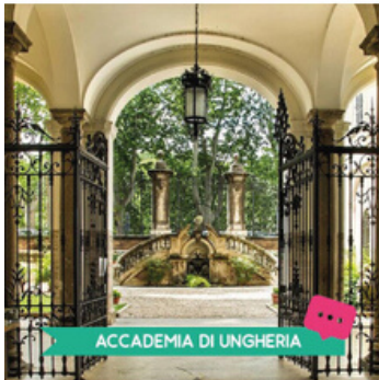
ACCADEMIA DI UNGHERIA